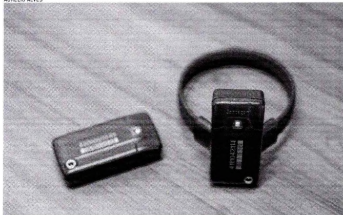
TORNOZELEIRAS estão em falta para novos presos

LUCAS BARBOSA lucasbarbosaaraujo@opovo.com.br