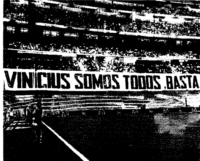
Faixa da torcida no Bernabéu: "Somos todos Vinicius. Basta já"

Em jogo com diversas referências e homenagens a Vinicius Junior, que não entrou em campo, o Real Madrid derrotou o Rayo Vallecano por 2 a 1, ontem, pela 35ª e antepenúltima rodada do Campeonato Espanhol. Rodrygo anotou o segundo gol aos anfitriões, no estádio Santiago Bernabéu. O triunfo assegurou a classificação da equipe merengue à Liga dos Campeões da próxima temporada.